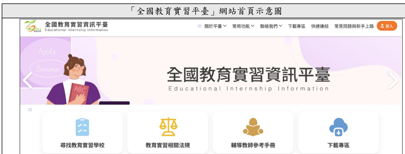
「全國教育實習平臺」網站首頁示意圖

https://eii.moe.edu.tw/module/tea-intern/module/tea-intern/welcome