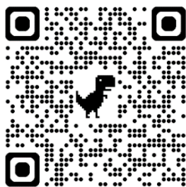
「全國教育實習平臺」網站 QRcode

https://eii.moe.edu.tw/module/tea-intern/module/tea-intern/welcome