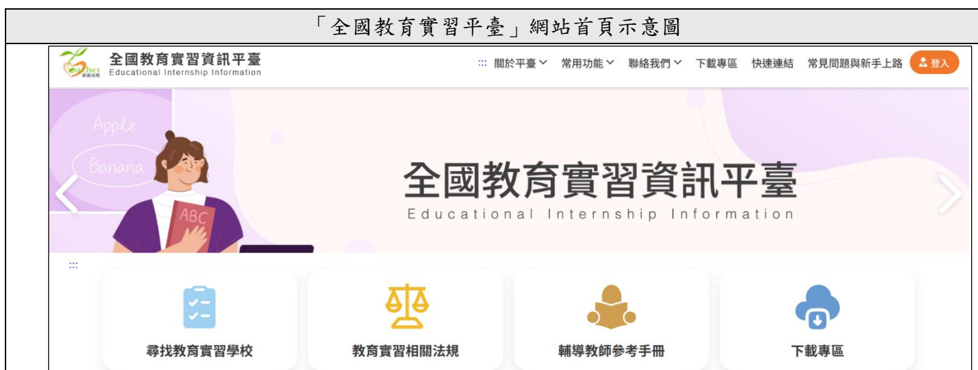
「全國教育實習平臺」網站首頁示意圖

https://eii.moe.edu.tw/module/tea-intern/module/tea-intern/welcome