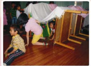
圖二：幼兒穿越螢火蟲隧道情景