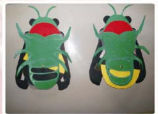
圖四：螢火蟲紙模型（背面）