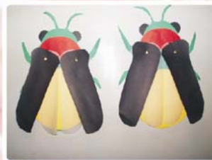
圖三：螢火蟲紙模型（正面）